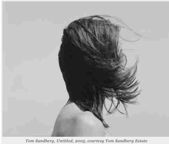
Tom Sandberg, Untitled , 2005

Venerdì 18, la Fondazione Fotografia Modena inaugurerà negli spazi del Foro Boario la nuova stagione espositiva con ben due mostre. La prima – dal titolo Fotografia contemporanea dall'Europa nord ovest. Capitolo I – è l'occasione per scoprire una parte delle nuove acquisizioni della fondazione, che punta a sondare la scena fotografica dei paesi europei nordici: si tratta di oltre 70 opere di 19 artisti, tra affermati ed emergenti, dell'area compresa tra Germania, Scandinavia e Gran Bretagna. Non ci si sposta dal nord Europa per la seconda mostra in programma: Tom Sandberg – Around myself è dedicata infatti ad omaggiare il lavoro del fotografo norvegese, scomparso poco più di un anno fa, con un corpus di opere in bianco e nero, mai viste in Italia prima d'ora.