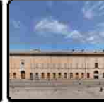
Fondazione Modena, verso il battesimo ufficiale. Con qualche nuvoletta (molto italiana) all'orizzonte...