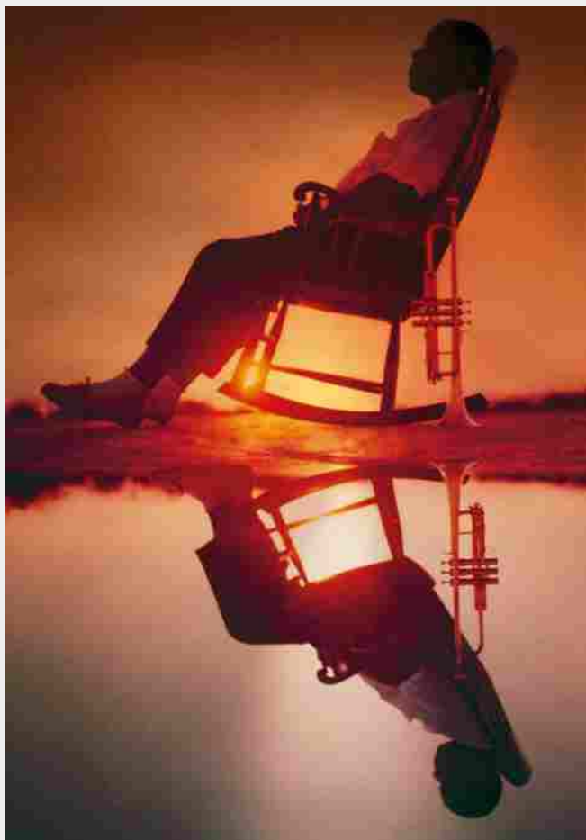
Art Kane, Louis Armstrong, Death Valley, Esquire 1958

Con l'estate ormai archiviata, le inaugurazioni – tra mostre, festival ed eventi culturali di ogni genere e sorta – hanno ripreso a tamburo battente in tutta Italia. Modena compresa. Ed è proprio la città emiliana che vi consigliamo per una gita fuori porta, in